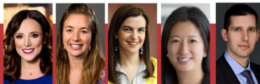
Gender Lens Investing