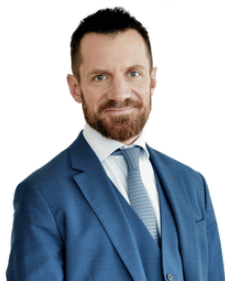
Guillaume Bonnel - Crédit Suisse